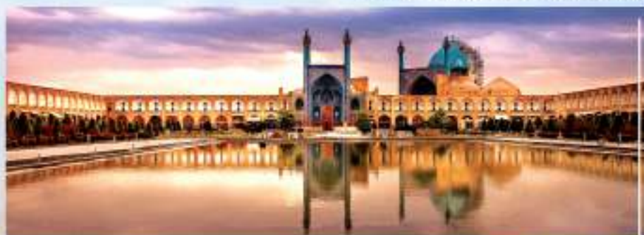
میدان نقش جهان

استان اصفهان به واسطه قرار گرفتن در مرکز ایران، دارا بودن شرایط اقلیمی، آثار و بناهای تاریخی ثبت شده ملی و جهانی و مرکز تولید صنایع دستی همواره مورد توجه بسیاری از گردشگران داخلی و خارجی بوده است. این شهر باستانی، در منطقه‌ای کویزری و در کنار رود زاینده رود قرار گرفته است. معماری منحصر به فرد، بناهای تاریخی بی نظیر و طبیعت زیبای این شهر، اصفهان را به مقصدی برای توریست‌هایی از سراسر جهان بدل کرده است. علاوه بر جاذبه‌های سیاحتی، این شهر در سال‌های اخیر در زمینه توریسم سلامت نیز پا به عرصه گذاشته است و به عنوان یکی از قطب‌های درمانی و گردشگری ایران نقش پر رنگی در جذب گردشگران سلامت دارد.