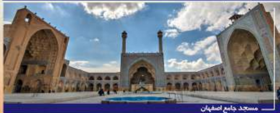
مسجد جامع اصفهان